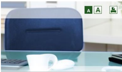
Einstellung in den Vorbereitungsdienst